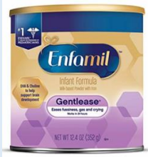
Enfamil Gentlelease Powder 12.4 oz, 19.9 oz, 27.7 oz