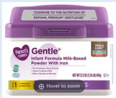
Parent's Choice Gentle Powder 12 oz, 21.5 oz, 34 oz