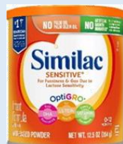
Polvo Sensible Similac 12.5 oz, 29.8 oz