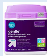
Up & Up Gentle Powder 21.5 oz