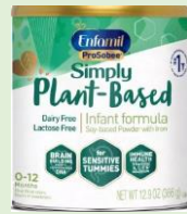
Enfamil ProSobee Powder 12.9 oz, 20.9 oz