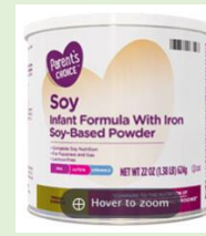
Parent's Choice Soy Infant Formula 22 oz