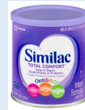
Similac Total Comfort Powder 12.6 oz