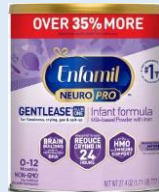
Enfamil NeuroPro Gentlelease Powder 19.5 oz, 27.4 oz, 30.4 oz