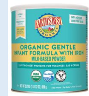
Earth's Best Organic Gentle 23.2 oz