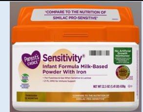
Parent's Choice Sensitivity 12,0 oz