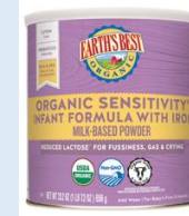
Earth's Best Organic Sensitivity 23.2 oz, 35 oz