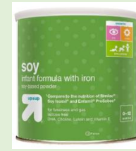
UP & UP Soy Infant Formula 36 oz