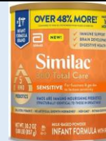
Similac 360 Total Care Sensitive Powder 30.2 oz