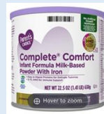
Parent's Choice Complete Comfort 22.5 oz, 29.8 oz