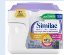
Similac PRO-Total Comfort Powder 29.8 oz