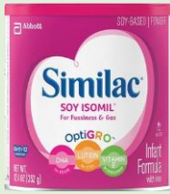
Similac Soy Isomil Powder 12.4 oz