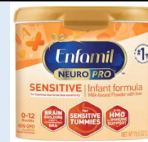
Enfamil NeuroPro Sensitive Powder 29.4 oz