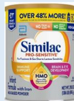
Similac Pro Sensitive Powder 29.8 oz