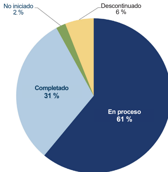
Figura 1: Progreso en las estrategias del Plan Olmstead de NC

Completado: la estrategia y todos sus pasos de acción se completaron antes o durante el Trimestre 3 de 2025.